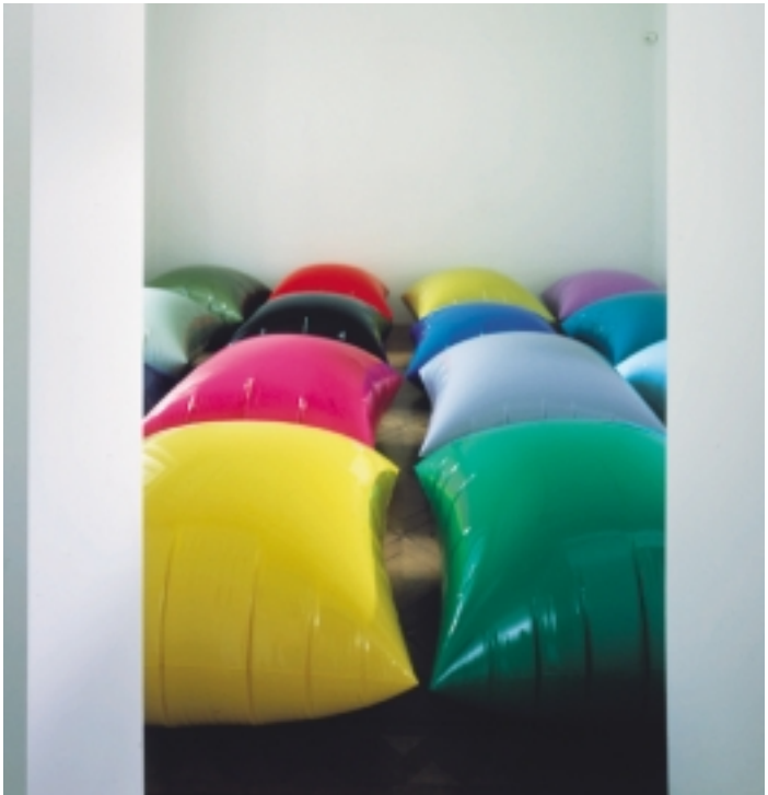
Gerwald Rockenschaub: O.T. (funky minimal), 1998

eines autonomen Kunstsystems verstehen, vertritt Elisabeth Ensenbergers Installation living in a perfect world als Darstellung der heilen Spielwelt die entsprechende Gegenposition. Flavio Bonetti schließlich verschränkt in seinem Foto-Triptychon ‚The Big Dipper‘ Real- und Traumwelt mit der Spielwelt des Kindes zu spielerischen Konstellationen, welche die aktuelle Problematik globaler Warenüberflutung in astronomische Visionen überführen.