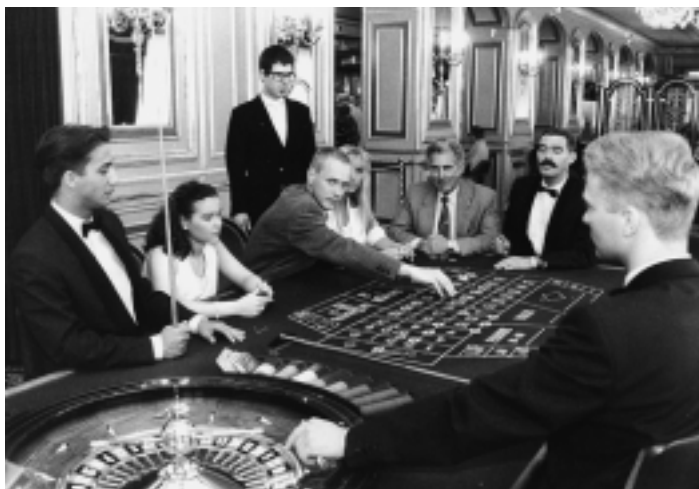
Christian Jankowski: Spiel mit Sponsorengeld, 1996

echte wie vermeintliche KunstbewegerInnen mit der Veröffentlichung ihrer Portraits in seinem ‚ARTmemory‘ zur Investition in Kunst verführt. Die Sponsoren, einflussreiche Spielfiguren auf dem Spielfeld der Kunst, haben in Christian Jankowski s gewitzter Persiflage Spiel mit Sponsorengeld das Nachsehen, da ihre Mittel beim Roulette zur erfolglosen Kapitalvermehrung eingesetzt werden. Die Gesellschaftsspiele Hype! Hit! Hack! Hegemony! Eva Grubingers sind ironische Demontagen von Codes und Mythen des Kunst- und Musikbetriebs, des Polittheaters wie der Internetcommunity, die den partizipierenden Mitspieler fordern und erst im Spielvollzug Einsicht und Erkenntnis gewähren.