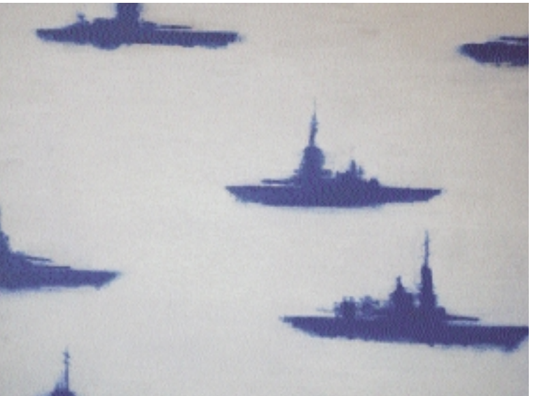
Schiffe, 2000 Öl auf Leinwand, 90 x 125 cm

Ebenso produktiv wie das Verfahren der Unschärfe erweist sich das Mittel der Hell-Dunkel-Kontrastierung, das von Uwe Wittwer als Blendung bezeichnet wird. Damit meint er vor allem die Steigerung lichter Partien zum blickverengenden Gleißeln einerseits und dunkler Schatten hin zu Schwärze und brandigen Spuren andererseits. Diese Methode der Bildbearbeitung generiert jene konstitutiven Negativeffekte, die gerade alltägliche Szenarien schlagartig verfremden und in Unruhe versetzen.