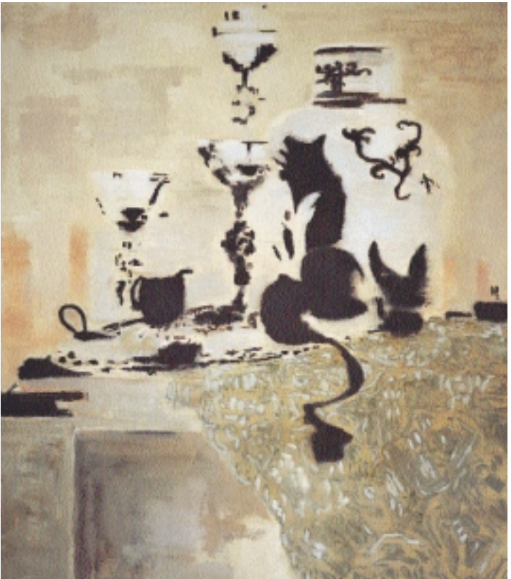
Stilleben negativ nach Kalf, 2004 Öl auf Leinwand, 195 x 170 cm

calls 'blinding'. What he means by this is, on the one hand, the extreme intensification of bright passages to a gaze-narrowing glare and, on the other hand, of dark shadows to black and burnt traces. This method of image processing generates the constitutive effect of photographic negatives that distort everyday sceneries in particular, putting them in unrest. The third image strategy that should be mentioned is connected to the multiply encoded origin of his pictorial