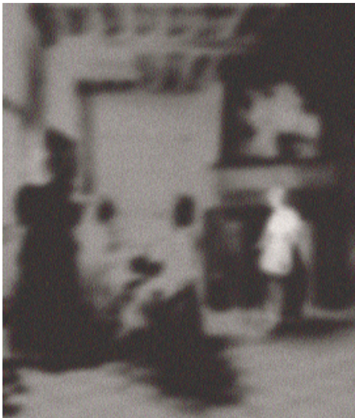
Interieur nach de Hooch, 2001 InkJet auf Aquarellpapier, 145 x 110 cm

Dabei aber wird das Vanitas-Gewisper ohne Larmoyanz vollzogen; nicht die ewige Klage, daß alles eitel sei, wird erneut repetiert, sondern ein tiefes Einverständnis mit der Befristung des Daseins zeitigt viel eher eine umfassende Genußfähigkeit der erfahrenen Momente. Vielleicht ist es eine Trauer über die Wandelbarkeit der Kultur, über geistige Verluste und entschwundene Vitalitäten, die die Arbeiten von Uwe Wittwer wie eine retardieren-