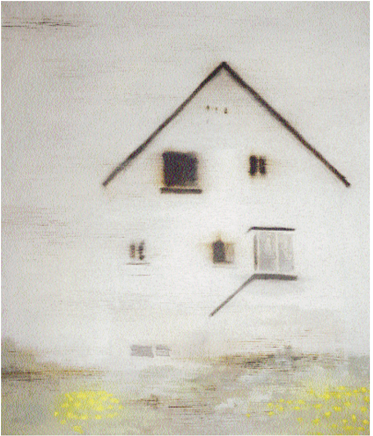
Haus, 2002 Öl auf Leinwand, 195 x 160 cm

genau die Art von nicht nobilitiertem Bildmüll, wonach Uwe Wittwer unwillkürlich suchte.